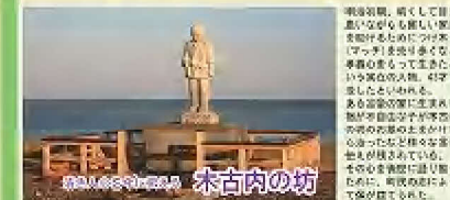
本吉内町 戊辰戦争の激戦地

戊辰戦争(箱館戦争)の激戦地。本吉内町は、戊辰戦争の激戦地として知られています。本吉内町には、戊辰戦争の激戦地に関する資料が豊富にあります。