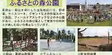
ふるさとの森公園