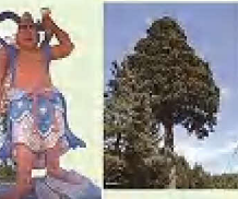
本吉内町 一本杉・地藏堂