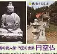
本吉内町 栗原邸大格