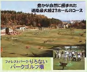
豊かな自然に囲まれた道南最大級27ホールのコース