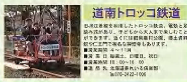
道南トロッコ鉄道