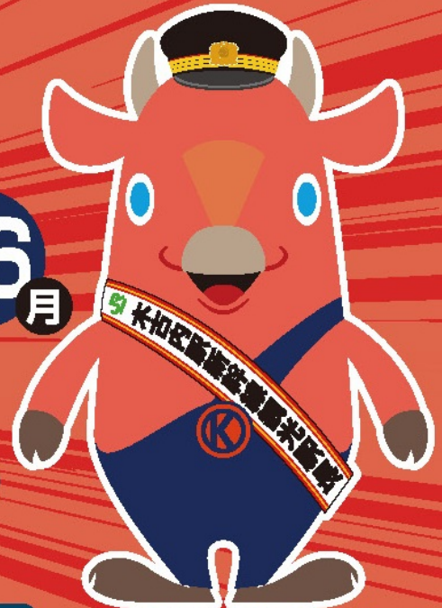
木古内町キャラクター【キーコ】